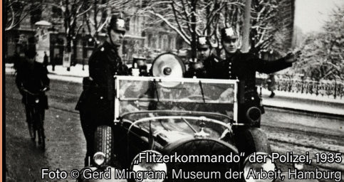
„Flitzerkommando“ der Polizei, 1935